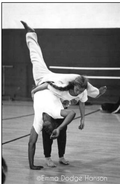
Nancy Stark Smith & Bill T. Jones (1998)

Elle nécessite un intense état d'éveil aux sensations pour rester vigilant, un relâchement des muscles pour réduire au minimum les impacts, une attention particulière à la structure du squelette pour utiliser au mieux sa mécanique, un état d'écoute à la fois actif et réceptif au travers de la peau pour communiquer à son partenaire confiance et soutien.